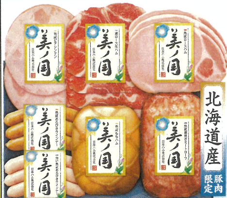
北海道 プレミアム 美ノ国